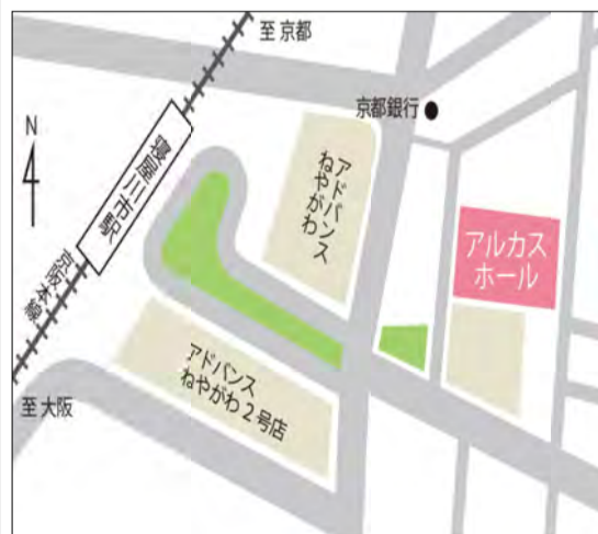
京阪「寝屋川市駅」より、東へ徒歩3分

定時総会は、アルカスホールにて行います。 住所 寝屋川市早子町12番21号 ※アルカスホールには無料の駐輪・駐車場はありません。 近隣の有料駐輪・駐車場をご利用下さい。